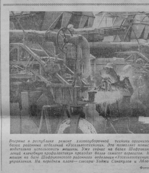
Впервые в республике ремонт хлопкоуборочной техники организован в централизованном порядке на базах районных отделений «Узсельхозтехника». Это позволяет повысить качество ремонта, более производительнее использовать машины. Уже сейчас на базах Шафранковского, Навоимского и других отделений «Узсельхозтехника» проходит более семисот агрегатов. На снимке: ремонт хлопкоуборочных машин на базе Шафранковского районного отделения «Узсельхозтехника» Вахтанговского производственного управления. На переднем плане — слесари Ходжи Санкулов и Абло Юлдашев.

нужно распространить и на совхозы, которые занимаются разведением сортовых семян люцерны высших репродукций. В республике насчитывается более 80 семейств высокопроизводительных машин, которые являются основой для семеноводства (кусульты). Основная часть семейств находится в ведении районных объединений «Узсельхозтехника». Надо прямо указать, что многие пункты работают плохо. Доставленные сюда семена люцерны лежат без движения, очистка их производится недоброкачественно. Это следствие того, что руководители органов «Узсельхозтехники» практически не несут никакой ответственности за очистку семенных фондов люцерны. Возникает необходимость разработать твердый график приема и сдачи семян люцерны на очистку, определить конкретные права и обязанности очистительного пункта и сдатчика семян. Вместе с тем следует установить единые и обоснованные расценки на очистку семян люцерны на электромагнитных и других семействительных машинах. Люцерна в нашей республике играет большую роль в создании прочной кормовой базы и в повышении урожайности хлопчатника. Стало быть, руководители колхозов, совхозов, сельхозхозяйств и партийных органов обязаны изменить свое отношение к этой ценной культуре, восстановить ее в правах.