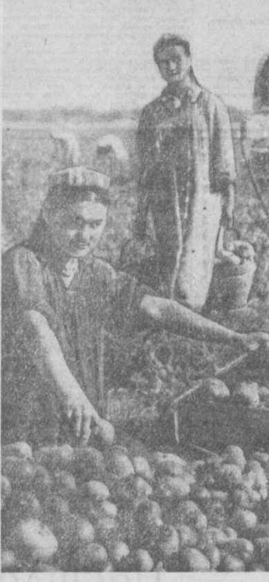
Более четырехсот пятидесяти тонн нового урожая продали государству труженники сельхозартели «Намуна» Термезского производственного управления. За последнее время они отвесили в торговую сеть по восемьдесят тонн помидоров ежедневно. На снимке: на сборе помидоров.