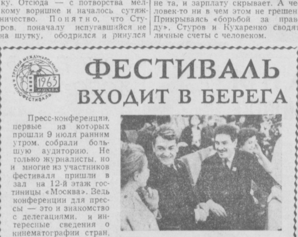
На III Московском международном кинофестивале в Кремлевском Дворце съездов. На снимке: советский режиссер, председатель жюри Григорий Чухрай и известный французский актер, член жюри Жан Марс.

Сегодня братский монгольский народ вместе с трудящимися нашего социалистического лагеря, всем прогрессивным человечеством торжественно отмечает свой самый большой национальный праздник — 42-ю годовщину победы народной революции и образования первого в истории страны народного правительства.