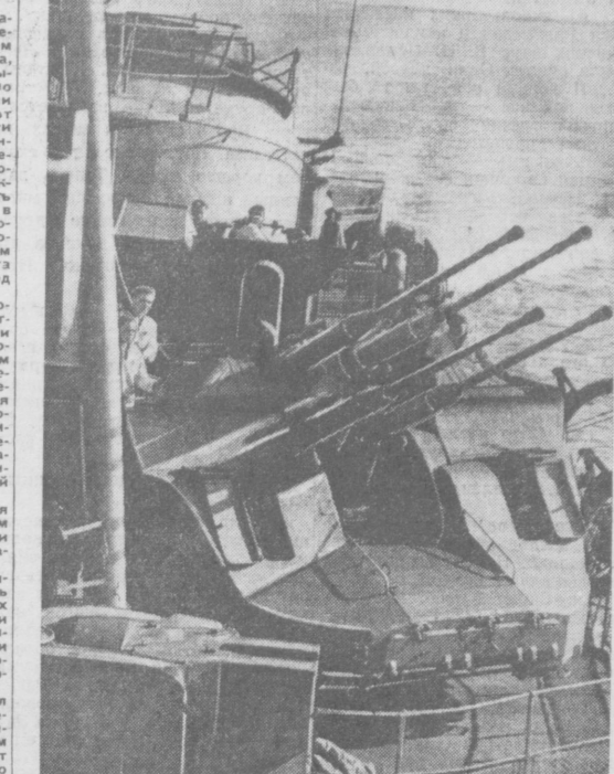
Тихоокеанский флот. Корабль в походе.

Кровная связь Вооруженных Сил СССР с народом, беззаветное служение ему, преданность делу Коммунистической партии являются залогом того, что, если агрессоры посягнут на свободу народов Советского Союза и стран социалистического лагеря, Армия и Военно-Морской Флот с честью выполнят все боевые задачи, которые поставит перед ними Родина.