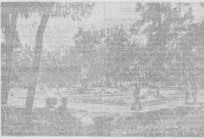
В Ташкенте благоустроены и открыты для отдыха трудящихся север между улицами Карла Маркса и Ленина. На снимке: в новом сквере.

Взаимопроверка помогла хлопкоборцам выявить дополнительные трудовые и материальные резервы для усиления работ полевых работ, содействовала улучшению работы по накоплению высокого урожая.