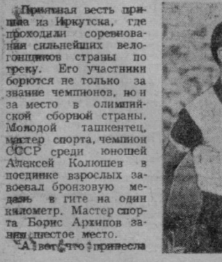
Приветная весть пришла из Иркутска, где проходили соревнования сильнейших велогонщиков страны по трассе. Его участники борются не только за звание чемпионов, но и за место в олимпийской сборной страны.