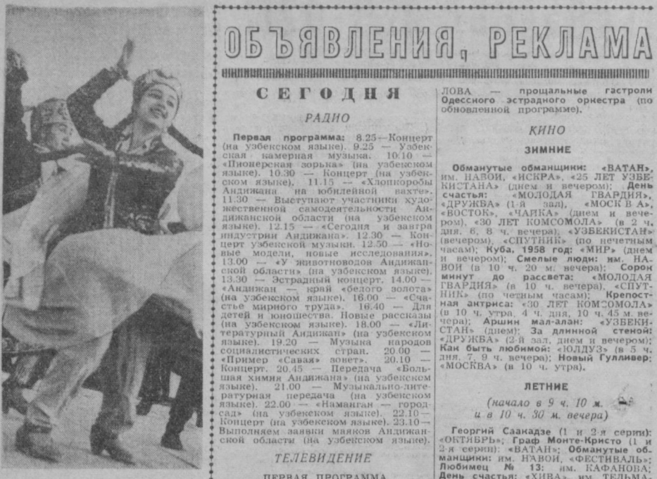
На днях этот «музыкальный поезд» побывал в Бухаре, где его участники дали большой концерт на стадионе «Спартак».