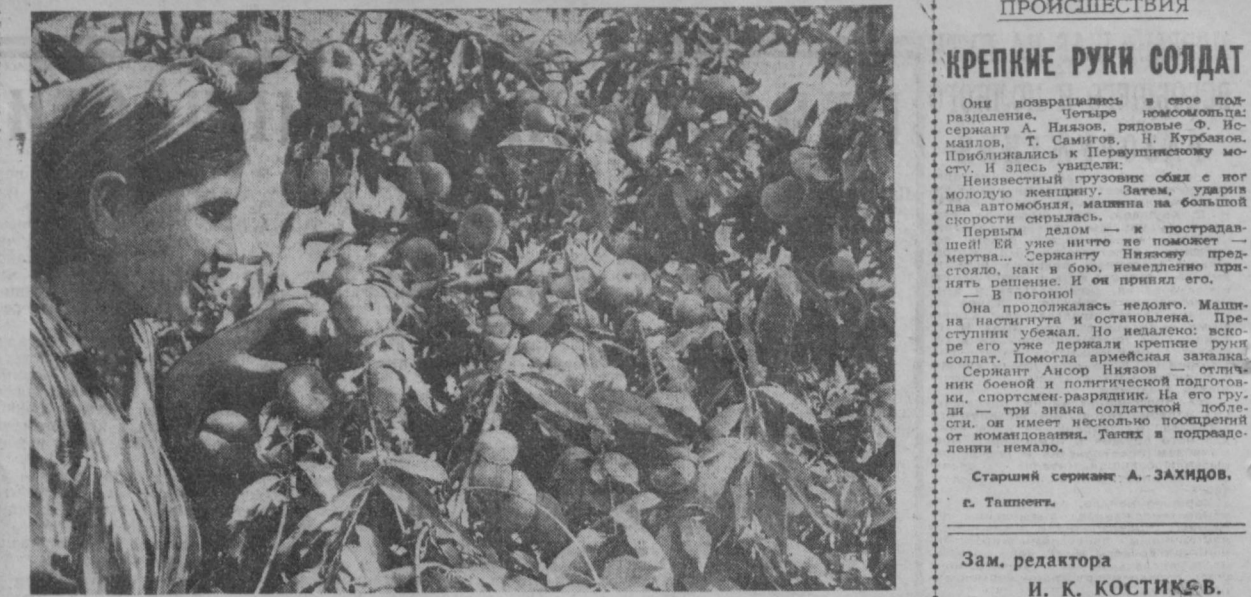
Не так давно по бескрайним просторам Голодной степи знойные ветры поднимали тучи пыли, безжалостно выжигали все вокруг. Но вот сюда пришла советский человек и укротил природу...