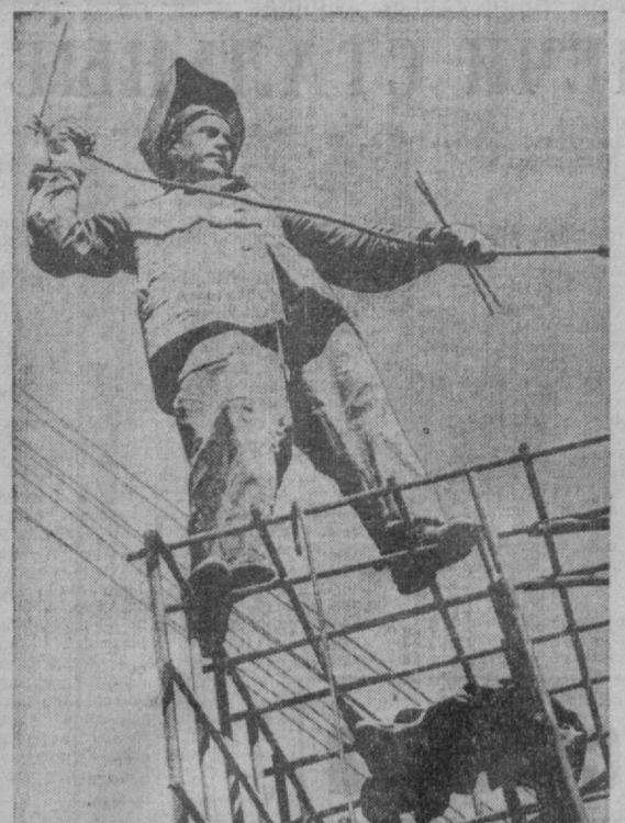
Хамчикская насосная станция входит в комплекс строительства Аму-Бухарского канала...

Хамчикская насосная станция входит в комплекс строительства Аму-Бухарского канала... (Article about a pumping station project)