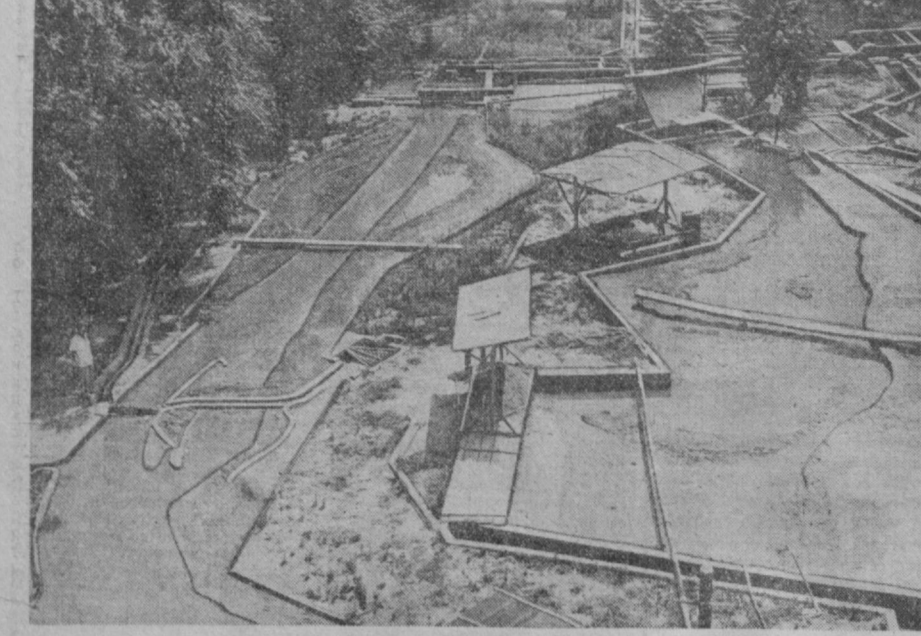
Аму-Дарья, Тахташат. Мощная плотина перегородила реку. Это в будущем. А пока мы в Среднеазиатском научно-исследовательском институте...

Типография объединенного издательства ЦК Компартии Узбекистана, г. Ташкент. Р.11821. Индекс 64572. Изд. № Б-506.