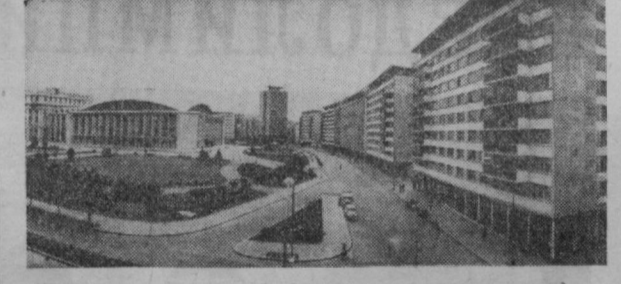
На снимке слева — площадь Республики с монументальным зданием Дворца Румынской Народной Республики в Бухаресте. Справа — Бизказский цементный завод, имеющий шесть технологических линий. Все оборудование завода изготовлено в Румынии.