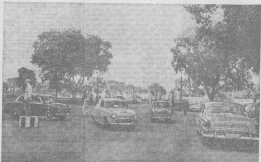
Столица Республики Индия — Дели. На площади перед зданием парламента.