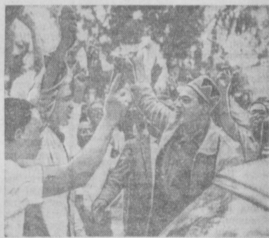
Жители столицы Кении Найроби приветствуют Джомо Кеннату.