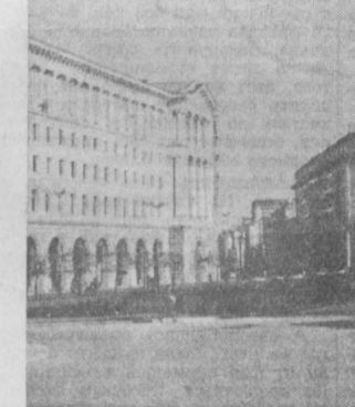
Столица Народной Республики Болгарии — София. Площадь имени Ленина.

водство предметов потребления возросло по сравнению с 1939 годом в 9 раз. Валовый национальный продукт вырос в 3,5 раза — с 1939 года в 10 раз, сейчас насчитывается 5 вузов, сейчас их 22. На каждые 10 тысяч жителей приходится тогда 16 студентов, теперь — 90.