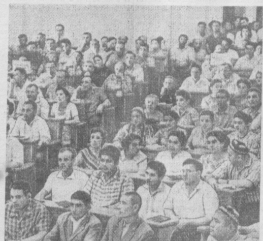
В зале заседаний съезда профсоюзов Узбекистана.