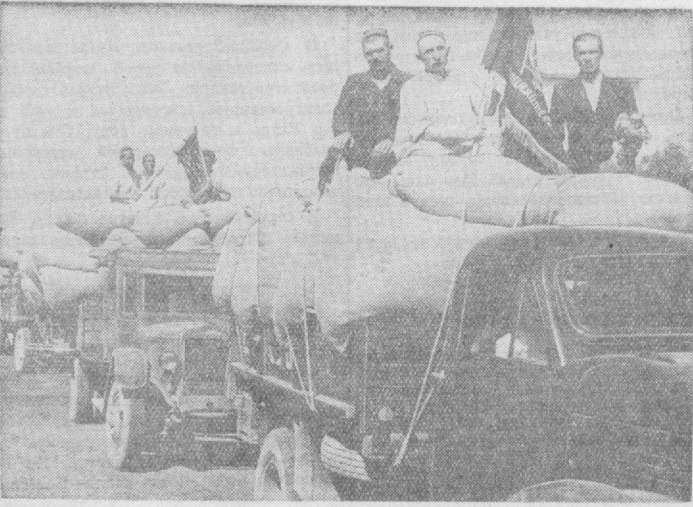
Бухарская область. Хлопководы сельхозартели имени Калинина, Бухарского района, приступили к массовому сбору хлопка нового урожая. Они уже сжали на загонный бунт более 20 тонн хлопка высшим и отборным сортами. На снимке: красный бунт с хлопком нового урожая колхоза имени Калинина, Бухарского района.