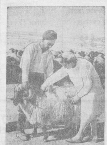
Катка-Дарынская область. Племхоз «Кара-Кум» выполняет план развития поголовья скота на 120 процентов, сдачу мушкет — на 105 процентов.

Магазин размещается в просторном и благоустроенном здании и располагает специализированными отделами: трикотажных и шелковых изделий, текстильных товаров, готового платья, обуви, посуды-хозяйственных товаров и другими.