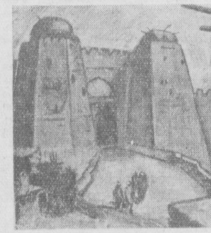
На снимке: эскиз В. Еремьяна к фильму «Авиценна».

Сложность работы над фильмом для художника усугублялась тем, что одиннадцатый век оставил в Средней Азии очень мало памятников изобразительного искусства. Чтобы глубоко проникнуть в суть явлений, прийти к монументальным обобщениям, помогающим понять фильм, передать самые разнообразные детали из жизни и быта народа, оформителям пришлось изучить и освоить огромный материал. Для передачи колорита эпохи большое значение имело изучение старых памятников Бухары, Самарканды, Хивы, особенно знаменитой мечети Рабат-Малик.