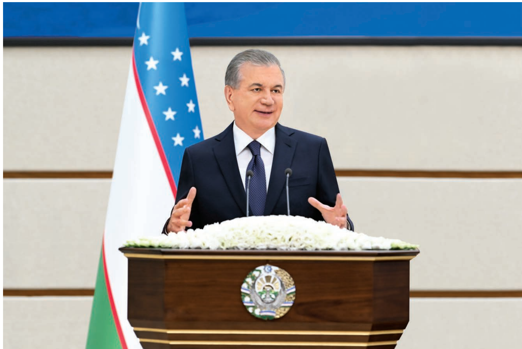
22 сентября в городе Нурафшане состоялась внеочередная сессия Ташкентского областного Кенгаша народных депутатов.

В ней принял участие Президент Республики Узбекистан Шавкат Мирзиёев.