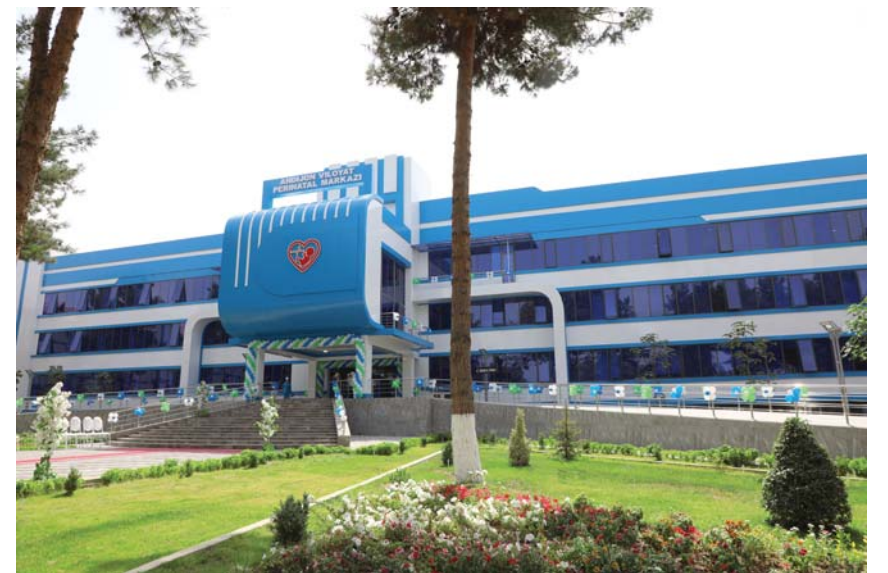
Зиёда аз 21,5 миллиард сўм маблағсарф гардид. Дар марказ қабулхона, 60 ҷой барои қабули ҳомилаҳои бемор, 30 ҷой барои кўдакони бемор, инчунин барои шўббаи реаниматсияи кўдакона 12 ҷой ҷудо карда шудааст. Айнӣ замон барои амалиёти гузаронидани донишҷўёни Институти давлатии тиббии Андиҷон хонаҳо ҷудо гардид. Дар бинои нави барои занҳои ҳомила, кўдакони навзод, инчунин баҳри самаранок пеш бурдани муолиҷа барои духтурон ҳамаи шароит фароҳамонд.

Барои барпо ва ҷихози марказ, ки барои 100 ҷой пешбинӣ шудааст,