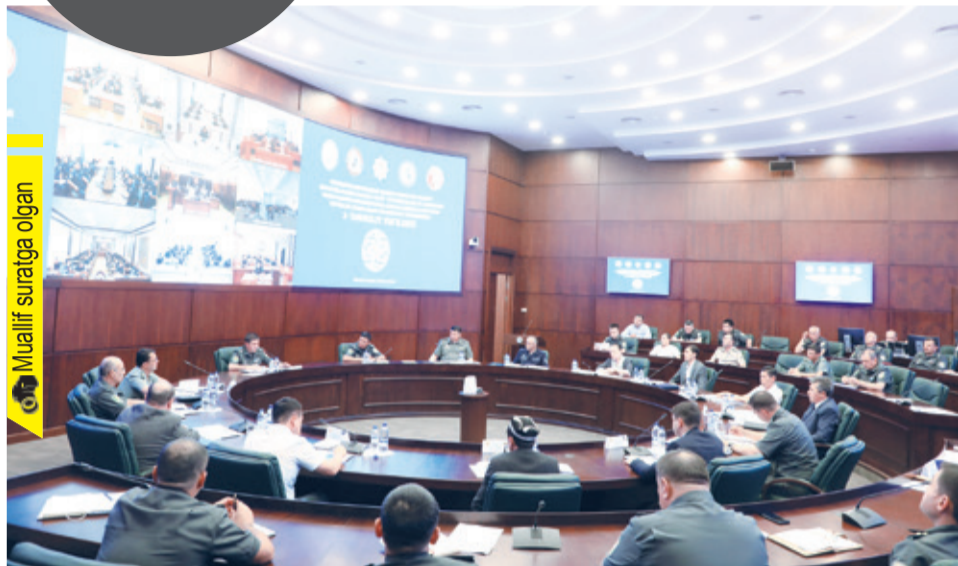
Muallif suratga olgan

га қарши курашишда ўз жонини ҳам аямайдиган, ватанпарвар, ҳалол ҳарбий хизматчиларни тарбиялаш ҳамда уларнинг ички ва ташқи таҳдидларга қарши мафкуравий иммунитетини шакллантириш асосий мақсад этиб белгиланган.