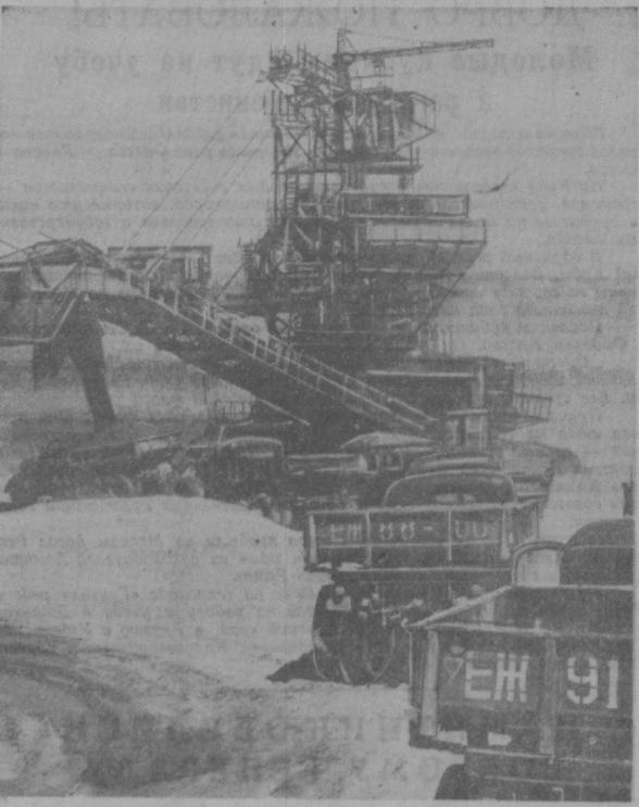
Непрерывным потоком подбоят машины (смотри снимок) к мощному роторному экскаватору, который наполняет их кувалдой грунтом. Затем они направляются к месту, где началось сооружение плотины Южносураханского водохранилища — единственной комсомольской стройки Узбекистана.

Н. АЛЕЕВ — корр. «Правды Востока»; Ю. КОМАРЬ — корр. газеты «Автотранспорт Узбекистана»; А. ПЕТРОВИЧЕНКО — корр. газеты «На посту».