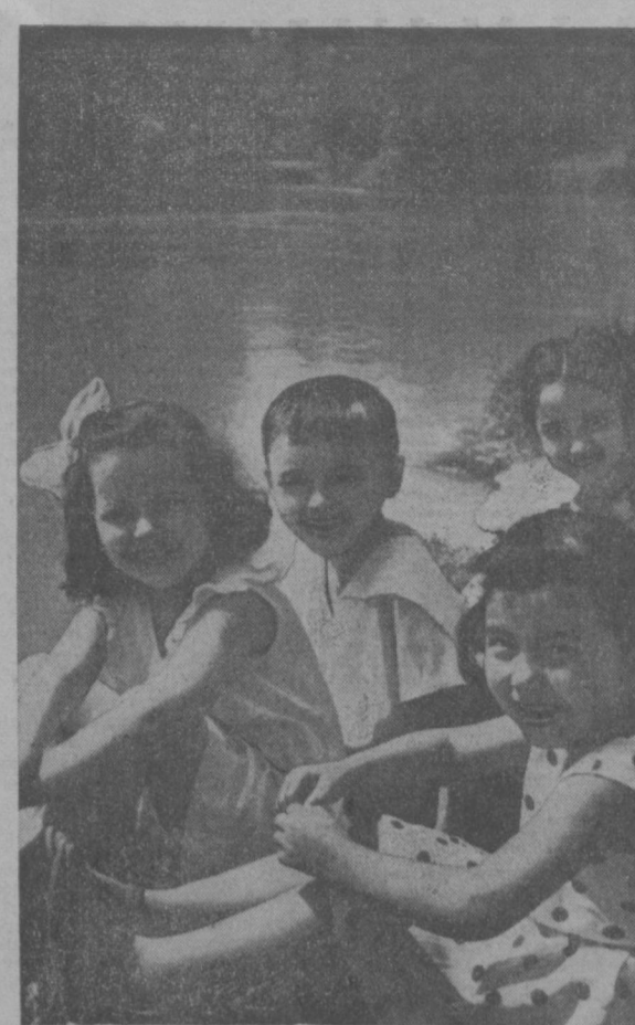
ХОРОШО НА БЕРЕГУ АНХОРА!

С. КРУПАЛЬНИК. Редактор газеты «Дизелист».