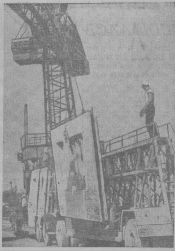
В предпобуднейшие дни наращивает производственные темпы коллектив Ташкентского обкомстроя комбината. Ежедневно с конвейера предприятия сходят детали для десятков автоматов. На снимке: отправка готовой продукции на строительные участки.

БЕРЛИН, 7 октября. (Корр. ТАСС). Сегодня здесь состоялся парад и демонстрация в честь 15-летия Германской Демократической Республики.