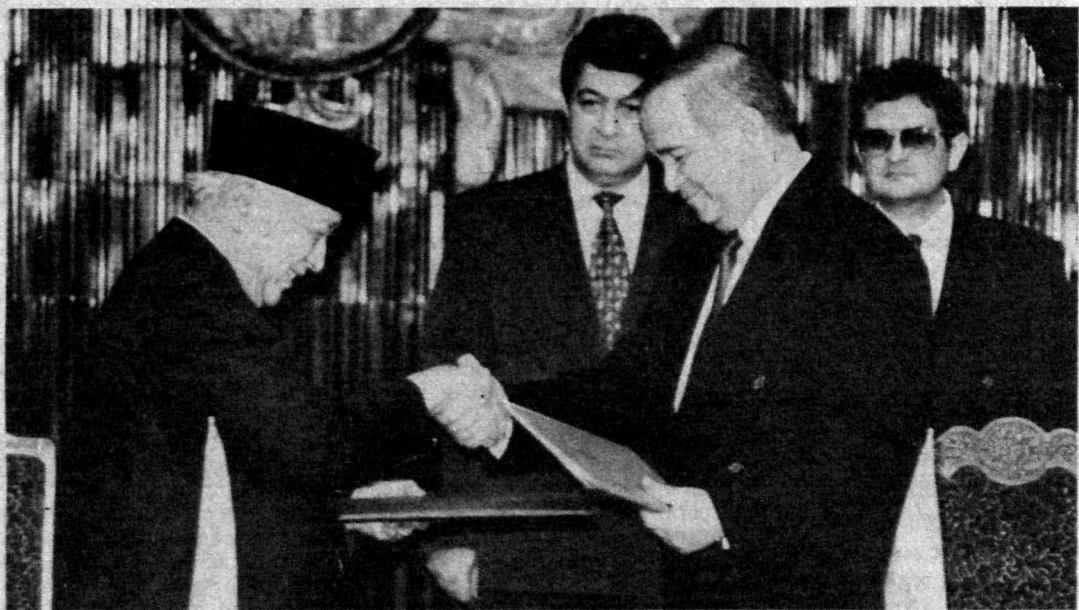
На снимке: во время подписания документов.