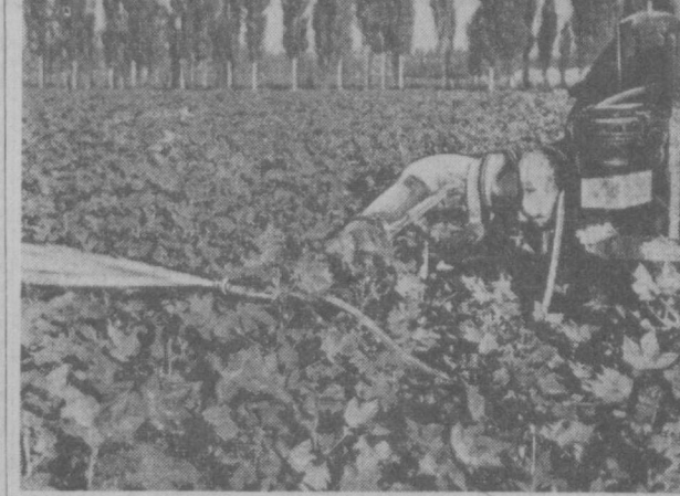
На этом снимке вы видите, как ведется обработка хлопчатника агрохимикатами в колхозе «Кзыл колдуз» Сталинского района Андижанской области.

ЦК Компартии Узбекистана и Совет Министров республики, говорится в постановлении, обращаются ко всем партийным, советским, сельскохозяйственным и заготовительным органам, комсомольским организациям, во всем руководителем колхозов и совхозов, во всем колхозникам, рабочим совхозов и специалистам сельского хозяйства с призывом приложить все силы к тому, чтобы провести уборку урожая хлопка организованно, с честью выполнить принятые социалистические обязательства — дать Родине 3,200 тысяч тонн хлопка-сырца и достойно встретить XXII съезд КПСС.