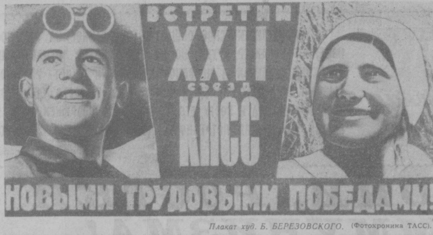
Плакат худ. Б. БЕРЕЗОВСКОГО.