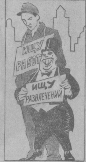
Воспеваемое «благоденствие» буржуазного строя — это благоденствие для кучки капиталистов и мук, страдания для сотен миллионов людей труда. Рис. С. Чистянова.

Нельзя было не заметить в рабочем районе отсутствие флагов