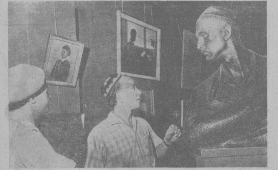
НА СНИМКЕ: уловок выставочного зала. У скульптуры Н. Федориды «Хамза».