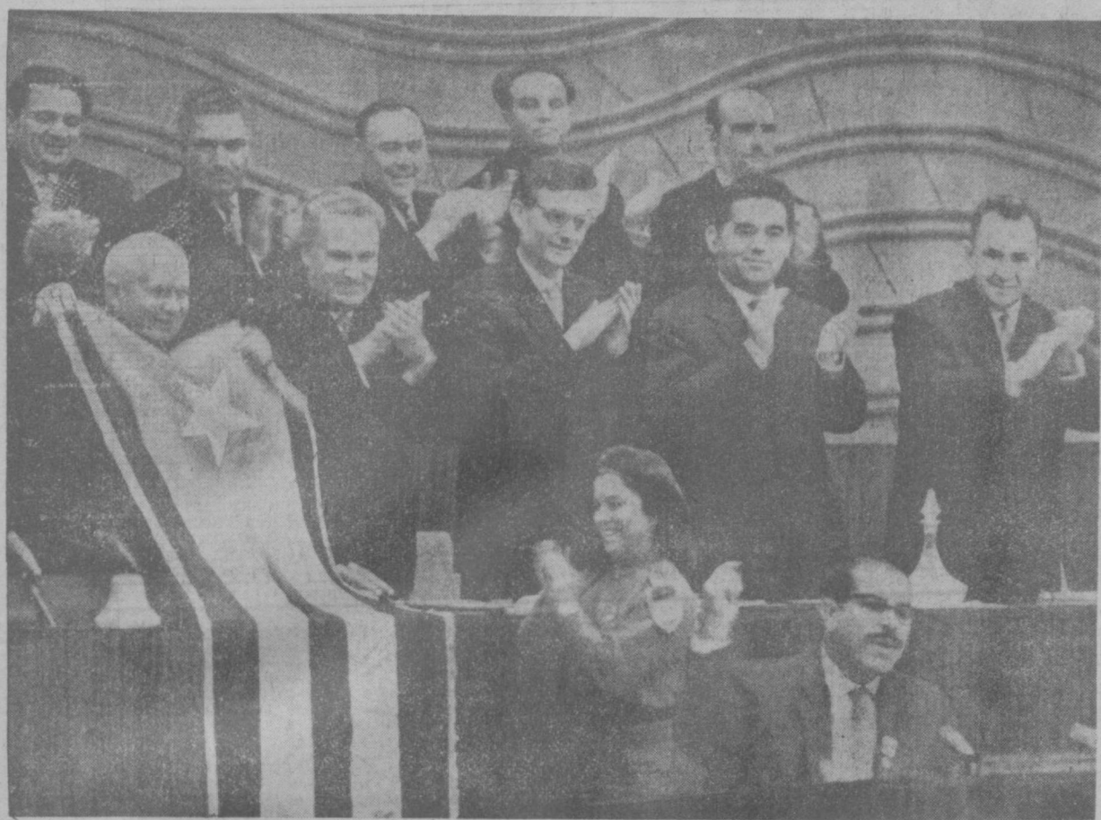
21 октября на вечернем заседании XXII съезда КПСС представители героического кубинского народа — член руководства Объединенных революционных организаций Кубы товарищ Блас Рока и кубинская девушка товарищ Рита Диас вручили товарищу Н. С. Хрущеву знамя кубинской революции. В эти торжественные минуты в зале звучали слова: «Вива Куба!». Никита Сергеевич Хрущев под восторженные овации всего зала, жюри «Ура» провозгласил: — Да здравствует революционная Куба!