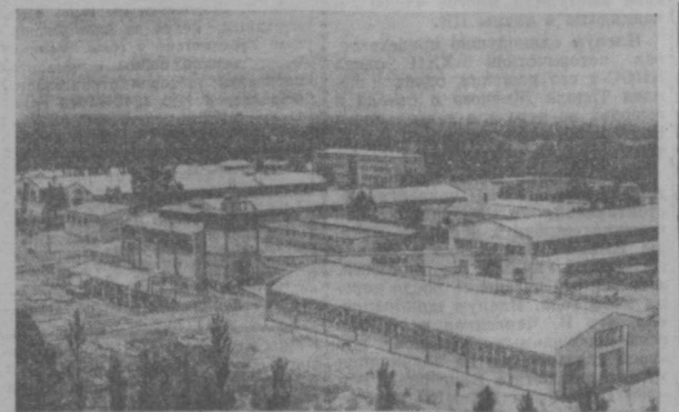
Индустриальным сердцем Афганистана называют Джангалейский авторемонтный завод, построенный при техническом сотрудничестве Советского Союза.