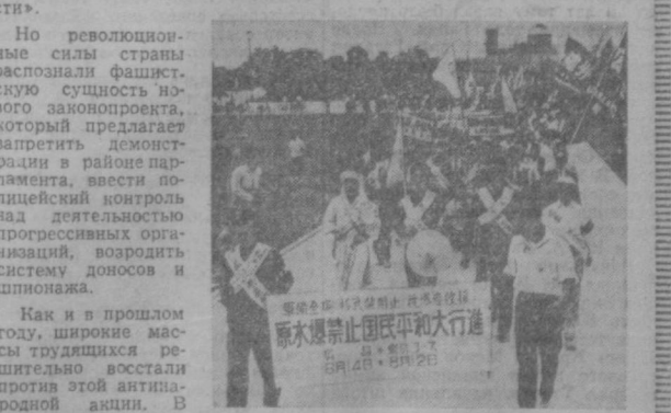
Японский народ, испытавший на себе все ужасы ядерной войны, решительно и упорно борется за запрещение атомного и водородного оружия и за разоружение. «Хиросима не повторится!» — такова воля японского народа, всего прогрессивного человечества.