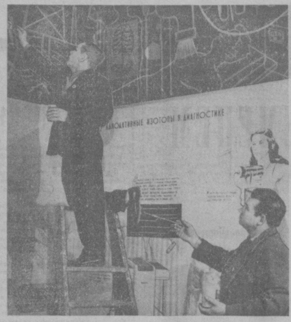
На этом снимке фотокорреспонденты Б. Мазур и А. Горюк запечатлели облик из углов нового демонстрационного зала-магазина — отбои защитной техники.