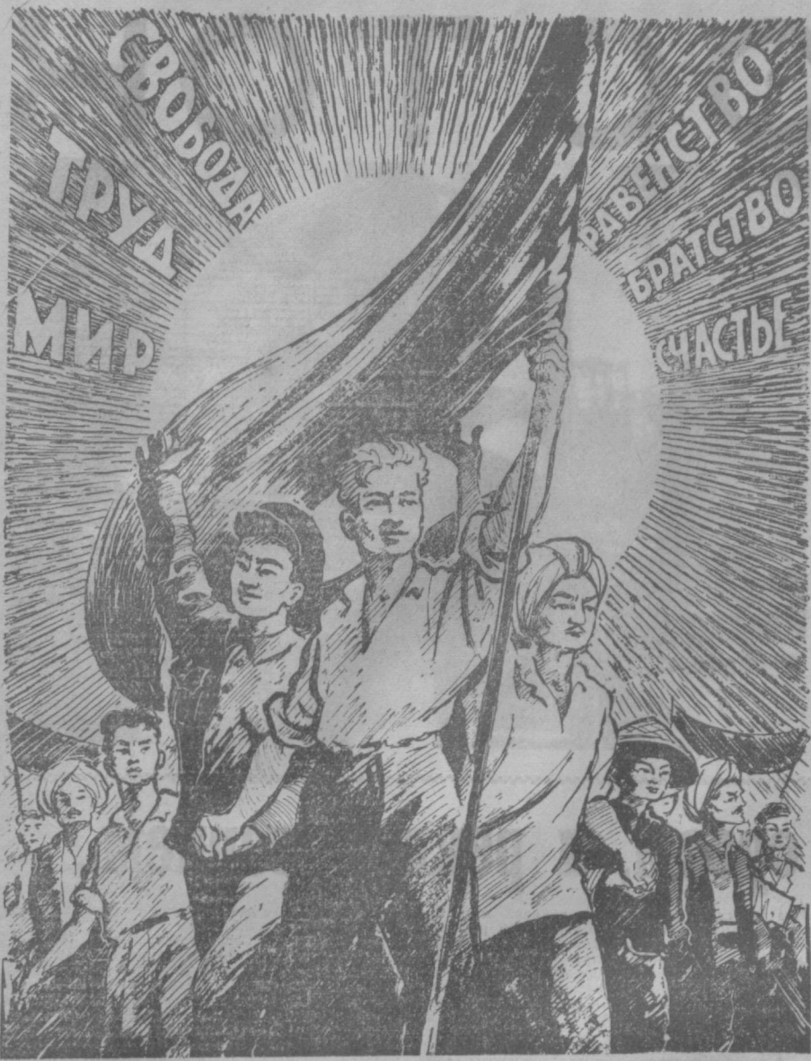
Рис. П. Воронкина.

ВОЗНИКНОВЕНИЕ СОЦИАЛИЗМА ЗНАМЕНУЕТ НАСТУПЛЕНИЕ ЭРЫ ОСВОБОЖДЕНИЯ УГНЕТЕННЫХ НАРОДОВ. (ИЗ ПРОГРАММЫ КПСС)