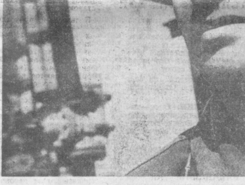
На Навоийской ГРЭС развернулись работы по сооружению очередного, девятого энергоблока мощностью 160 тысяч киловатт...