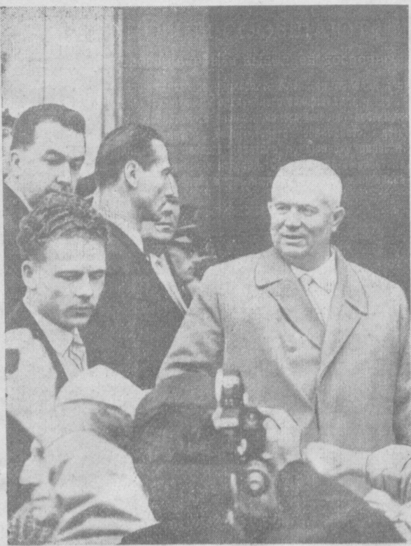
Н. С. Хрущев в городе Бордо. НА СНИМКЕ: во время встречи.