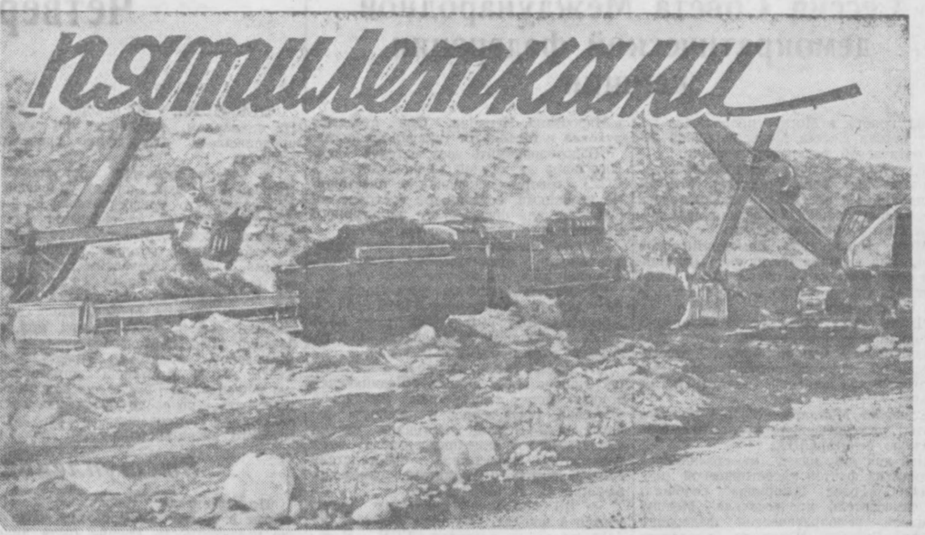
Ангрен. Подготовка пласта угольного разреза и добыча.

Механизмами — врубными машинами, конвейерами, электровозами. Построены предприятия, обеспечивающие наши многочисленные стройки цементом, огнеупорами, кирпичом, выпускающие товары широкого потребления.