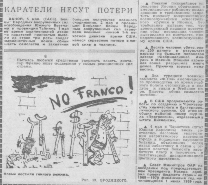
Рис. Ю. БРОДИЦКОГО.