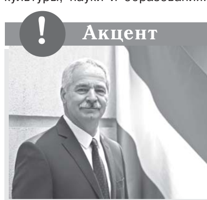
Дьюла Ковач, посол Венгрии в Узбекистане

Помимо наших хороших политических отношений и развития перспективного экономического сотрудничества, мы также заинтересованы в укреплении уз, связывающих наши народы и в области культуры, науки и образования.