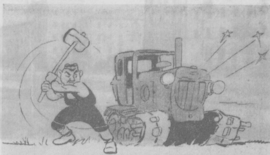
— Не ударишь, не поедешь

Но это только слова. Председатель колхоза за эти дни не привнес в работу ни одного слова, не сваливая вину на погоду. Это хорошо, что он тревожится за план, но плохо, что почти ничего не предпринимает для того, чтобы повысить темпы и качество сева.