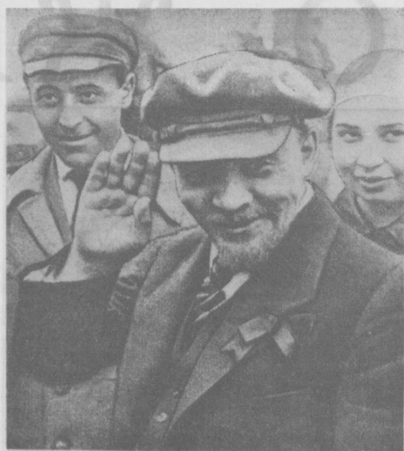
В. И. Ленин на закладке памятника «Освобожденный труд». Москва, 1 мая 1920 года (кинокадр).

Узбекский академический театр драмы имени Камы подготовил к показу литературно-драматическую композицию «Годы борьбы», посвященную 90-летию со дня рождения В. И. Ленина. Автор и постановщик композиции — народный артист Узбекистана Амин Турдыев — положил в основу спектакля отрывки из пьес «Кремлевские курьезы» и «Человек с ружьем» Н. Погодина, а также «Путевой звезды» К. Яшена.