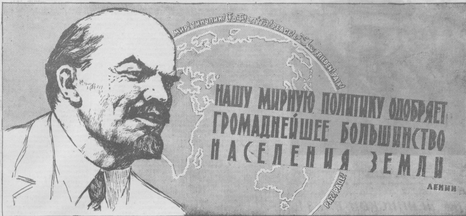
Планат художников В. Евенко и Б. Аванумова.