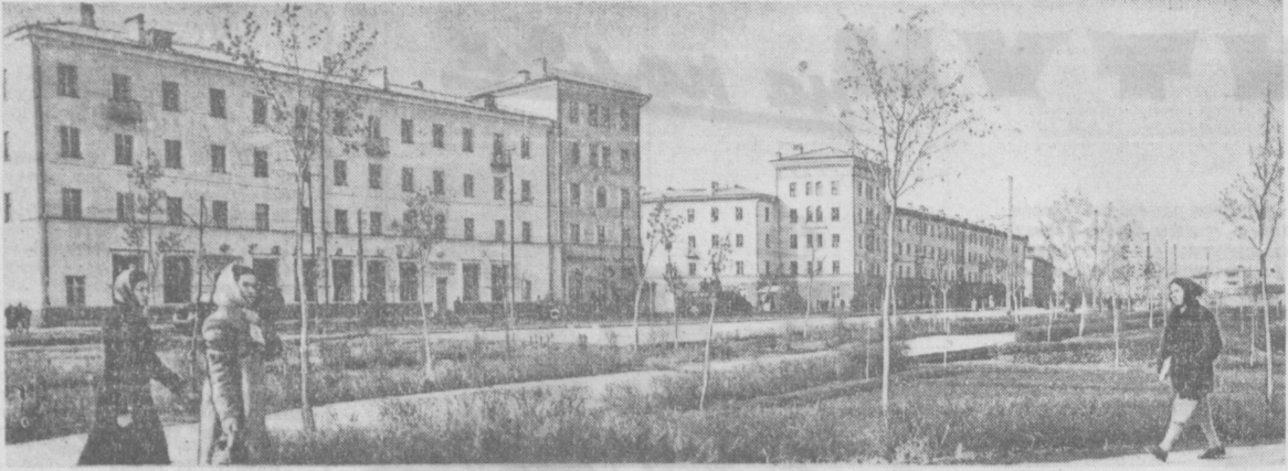
Расширяется и благоустраивается столица Узбекистана. На снимке: улица Богдана Хмельницкого сегодня.