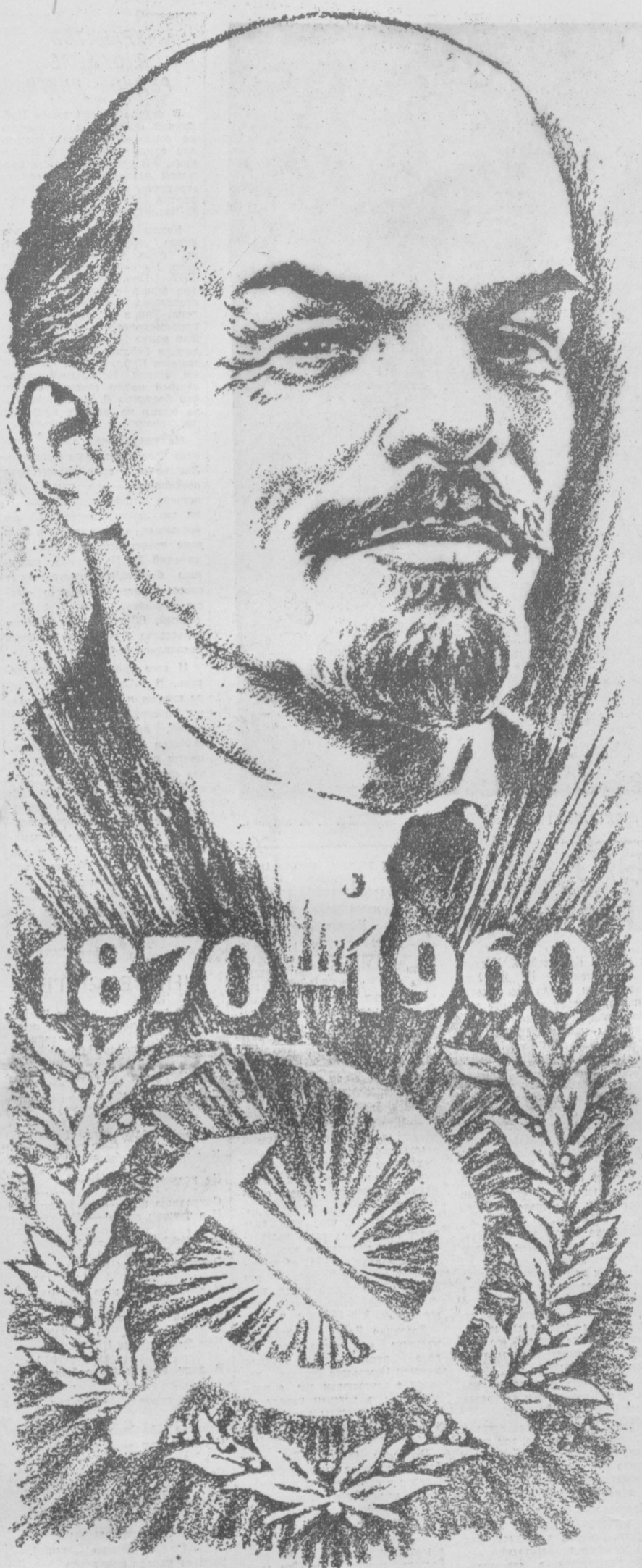
Рисунок народного художника Узбекской ССР В. Кайдалова.