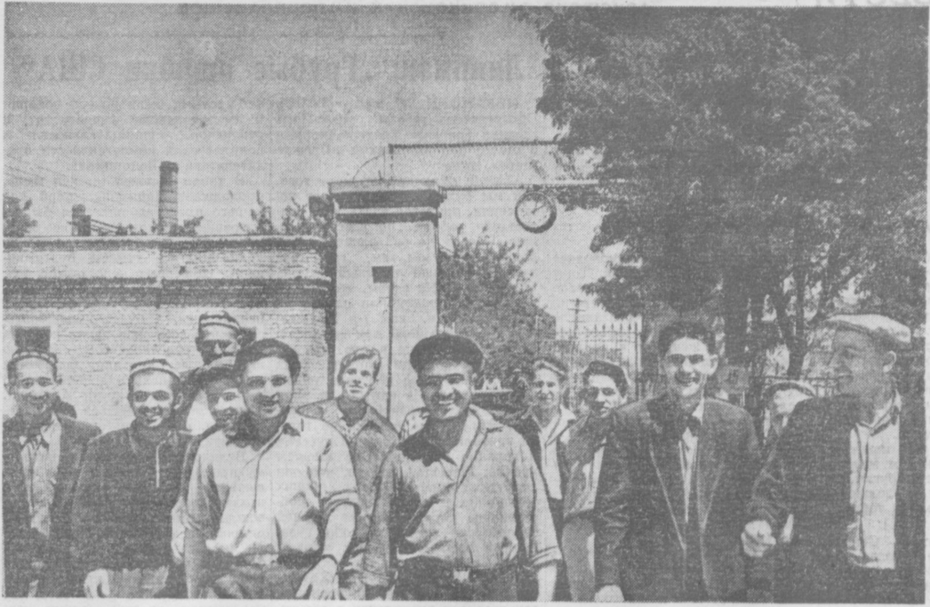
Окончен шестичасовой рабочий день. От заводских ворот идут металлурги...

Решения пятой сессии Верховного Совета СССР — в жизнь!