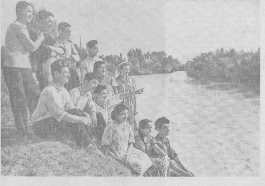
Получив аттестат зрелости, выпускники школ Средне-Чирчикского района решили остаться работать в колхозах своего района. НА СНИМКЕ: группа выпускников, изъявивших желание пойти на животноводческие фермы.

ТЕГЕРАН, 7 июня. (ТАСС). Тегеранский журнал «Ханданна» в передовой статье, озаглавленной «Агонизирующий меджлис», резко критикует деятельность нынешнего состава меджлиса, полномочия которого истекают в этом году. На протяжении четырех лет, пишет журнал, меджлис оставался слеп и глух к нуждам страны и народа. Он был свидетелем резкого повышения стоимости жизни и увеличения различных поборов. В ответ на это меджлис ограничивался лишь пустыми выступлениями нескольких депутатов. С его ведома в страну ввозились и ввозятся широкий ассортимент потребительских товаров, подрывающих внутренние устои страны.