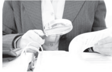
«Окончание. Начало на 1-й стр.»

Согласно постановлению, предпринимателям предоставлен ряд прав, которыми они до сих пор не обладали. Так, теперь бизнесмены вправе не допускать на свою территорию должностных лиц контролирурующих органов, если приказ о проведении проверки не оформлен в установленном порядке, проверка не согласована с Уполномоченным по защите прав предпринимателей или он не уведомлен об этом, отсутствует специальное удостоверение, дающее право на проверку деятельности предпринимателя, подтверждающие уклоняются от внесения информации в Книгу регистрации проверок.