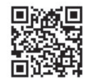
QR-кодни сканер қилиш орқали видеога ўтинг!

университетда таҳсил оляпти. Икки неварам эса бўлажак талаба, астойдил ўқишга киришга тайёрланыпти. Биз ўқимадиқ, ёшлар ўқисин, дейман. Уларга яратилаётган шароитларни кўриб қувонаман. Вилоятимизга Президентимиз келганида, мен ҳам нуронийлар сафида иштирок этдим. Қандай яшаётганимиз, муаммоларимиз билан қизиқди.