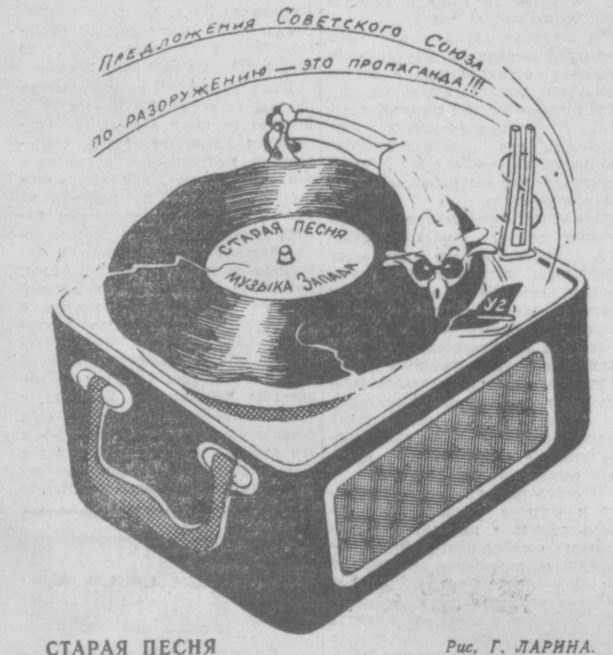
СТАРАЯ ПЕСНЯ Рис. Г. ЛАРИНА.