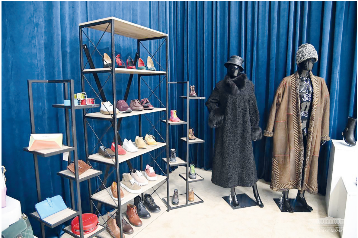
Бошланиши 1-саҳифада. ►►

ВИЛОЯТ АҲОЛИСИНИ ИШ БИЛАН ТЎЛИҚ ТАЪМИНЛАШ МЕЗОНЛАРИ БЕЛГИЛАНДИ