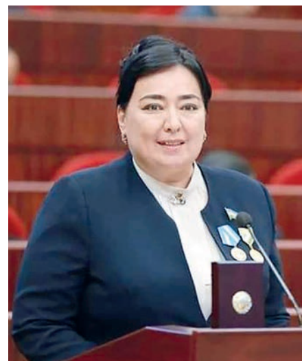
Барно МИРЗАМОВА, Олий Мажлис Қонунчилик палатаси депутати, O'zLiDeP фракцияси аъзоси

Беғубор болалигимиз, Ватанга муносабатимиз оиладан, маҳалладан бошланади. Дунёқарашимизнинг нечоғли покиза шаклланиши, урф-одатларимизнинг тамал тоши ҳам мана шу азиз масканлардан қўйилади.