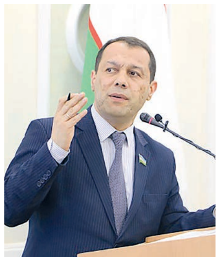
Равшан МАМУТОВ, Олий Мажлис Қонунчилик палатаси Аграр ва сув хўжалиги масалалари қўмитаси раиси

Мамлакатимизда қишлоқ хўжалиги соҳасини ислоҳ қилиш, озиқ-овқат хавфсизлигини таъминлаш, аҳолининг арзон ва сифатли маҳсулотларга бўлган талабини қондириш бўйича сўнгги йилларда қатор чора-тадбирлар амалга оширилмоқда.