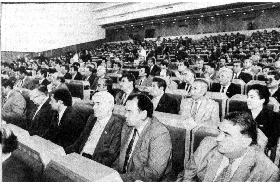
На снимках: в зале заседаний Олий Мажлиса Республики Узбекистан.