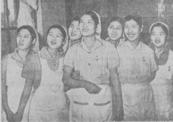
Вверху — одна из главных улиц Пхеньяна, столицы Корейской Народно-Демократической Республики. Внизу — группа передовых работниц Пхеньянского текстильного комбината, производящего половину тканей, выпускаемых в стране. Во время освободительной войны комбинат был полностью разрушен американскими бомбардировками американских империалистов. К концу 1956 года с помощью Советского Союза предприятие было восстановлено и оснащено современным оборудованием. В честь праздника коллектив комбината изготовил сверх плана 2 миллиона 800 тысяч метров тканей и сотни тысяч пар белья.