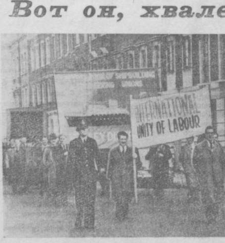
АНГЛИЯ: бастуют горняки, металлисты, рабочие судовых верфей.