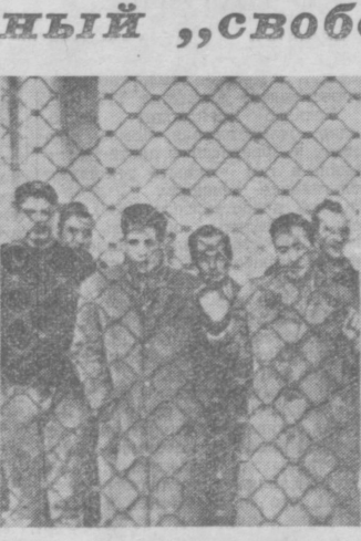
ИТАЛИЯ: рабочие за решеткой.