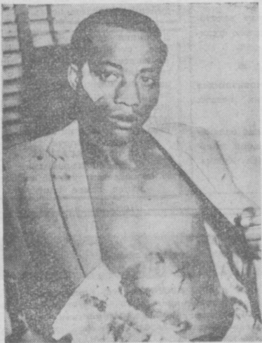
США: суды Лича. Истерзанный кулацко-клановцами молодой негр.