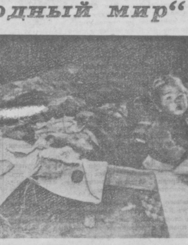
ЯПОНИЯ: голод и нищета народа.