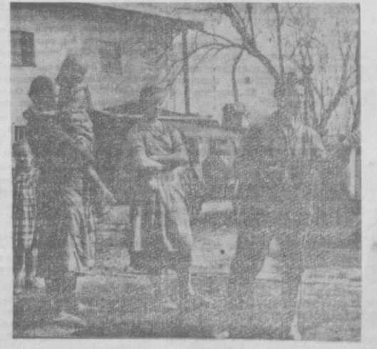
ФРГ: крестьяне, изгнанные с земли, ставшей военным полигоном.