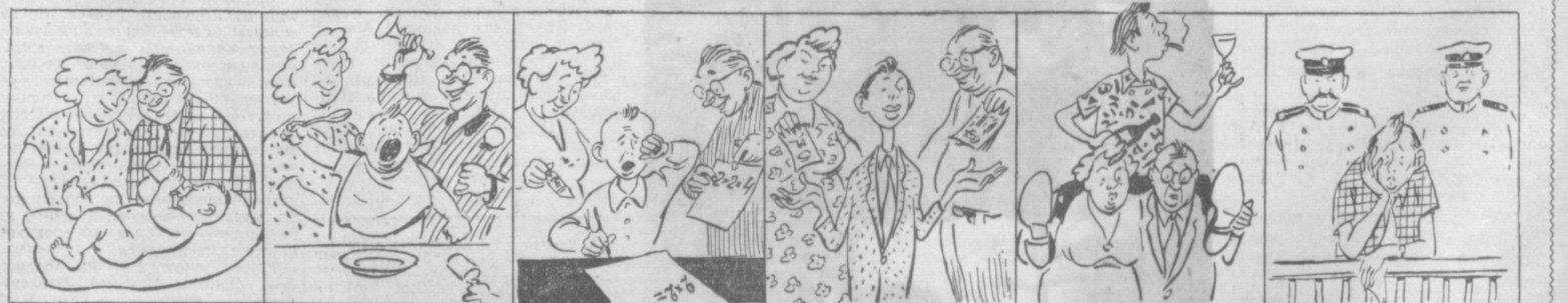
МЛАДЕНЧЕСТВО ДЕТСТВО ОТРОЧЕСТВО ЮНОСТЬ МОЛОДОСТЬ «ЗРЕЛОСТЬ» Рис. М. Воробейчикова.