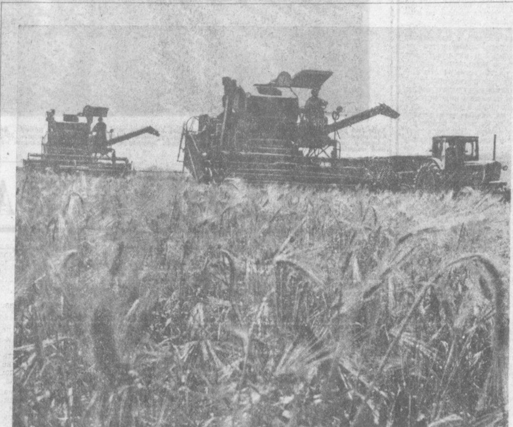
1.200 тонн зерна в закрома государства — таковы обязательства хлеборобов совхоза «Савай» Андижанской области. На полях кипит напряженный труд. Десять комбайнеров, работая в две смены, ежедневно убирают более ста гектаров. На снимке: уборка ячменя в совхозе «Савай».

Хороший, полноценный отдых — залог здоровья, бодрости, силы и высокой работоспособности. И надо делать все, чтобы он был именно таким.