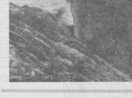
Вышло так, что все 18 человек, не сговариваясь, разом зазпели трогательную свою сердечностью песню «Березы». И было от чего зазпеть. Ребята планили горделивые белокобые березы на фоне голубого, как небо, Искандер-Куля и нежно-розовых на

Наш солнечный край издавна привлекает десятки тысяч любителей путешествий. Их манил сюда экологически чистая и изумительная архитектурные памятники древних городов Узбекистана — Самарканда, Бухары, Хивы, буквально стали местами паломничества многотысячных туристов нашей страны, зарубежных гостей.