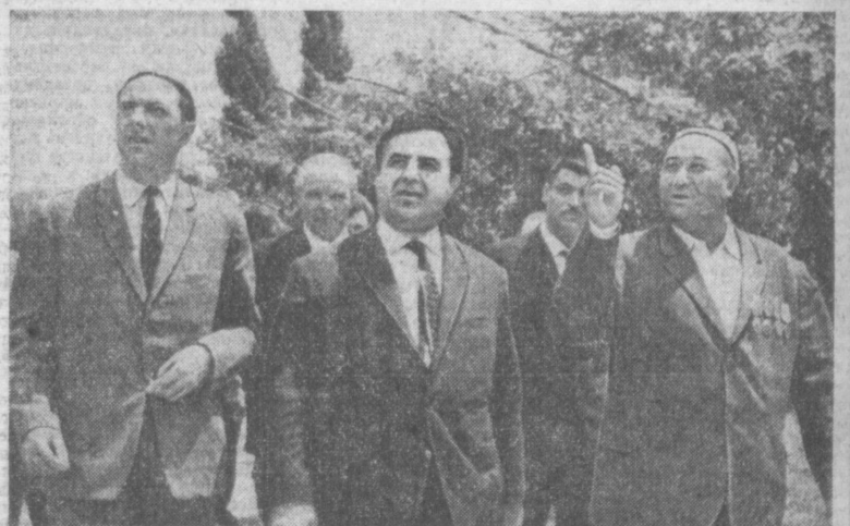
Пребывание в Узбекистане партийно-государственной делегации Сирийской Арабской Республики. На снимке: слева — сирийские гости на Ташкентском текстильном комбинате; справа — высокие гости из Сирии в колхозе имени Хамраула Турсункулова.