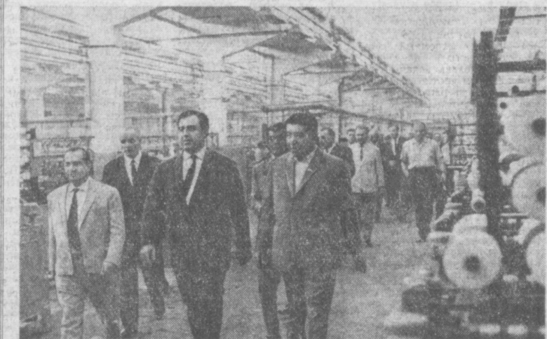
Пребывание в Узбекистане партийно-государственной делегации Сирийской Арабской Республики. На снимке: слева — сирийские гости на Ташкентском текстильном комбинате; справа — высокие гости из Сирии в колхозе имени Хамраула Турсункулова.

От имени Совета Министров Союза Советских Социалистических Республик сердечно приветствуют участников и гостей VI Московского международного кинофестиваля. Международные кинофестивали в Москве стали традиционными смотрами прогрессивного киноискусства, обладающего огромной силой воздействия на формирование духовного мира современного человека. Знаменательно, что VI Московский кинофестиваль проводится накануне великой даты — столетия со дня рождения основателя и руководителя первого в мире социалистического государства Владимира Ильича Ленина, жизнь и деятельность которого была посвящена борьбе за свободу и счастье трудящихся всех стран. Советский народ высоко ценит произведения киноискусства, отмеченные глубиной и правдивостью отображения действительности, силой жизнеутверждающих идей, художественным совершенством. В наши дни особенно важно, чтобы такое могучее искусство, как кинематограф, служило общественному прогрессу, объединению людей в борьбе за прочный мир и безопасность народов. Этим благородным целям отвечает девиз фестиваля: «За гуманизм киноискусства, за мир и дружбу между народами!». Поздравляю вас с началом нового международного смотра достижений киноискусства в столице нашей Родины — Москве и желаю его участникам и гостям творческих успехов. А. КОСЫГИН, Председатель Совета Министров СССР.