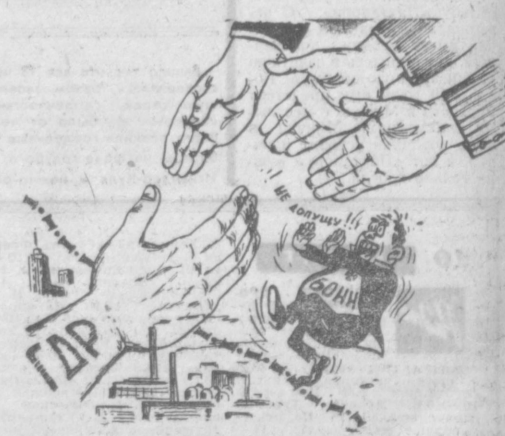
И ряд был... Рис. Ю. БРОДИЦКОГО.

Ураган необычайной силы пронесся над северной частью Франции. Волны в Бретани, непомерно высокие, пегиего 66 человек, многие из которых были сметены волнами в море, риде мертвые коровы, крышки, потоплены яхты и лодки. В Париже скорость ветра доходила до 28 метров в секунду.