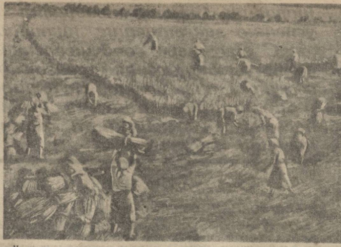
На полях освобожденной Кубани идет уборка колхозного урожая. На снимке: уборка урожая косами и серпами в колхозе имени Нико (Пластуновский район, Краснодарский край).