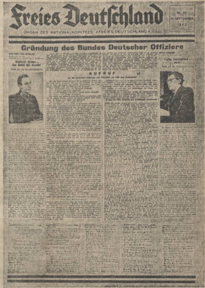
Первая страница газеты «Свободная Германия» № 10 от 18.IX 1943 г.

танковой дивизии, и другие. Союз принял публикуемое ниже «Обращение к немецким генералам и офицерам, к народу и армии». 14 сентября 1943 года состоялось заседание Национального Комитета «Свободная Германия», на котором было постановлено расширить состав Национального Комитета путём введения в него следующих членов Союза немецких офицеров: генерала артиллерии фон Зейдлица, генерал-лейтенанта Эдлера фон Даниельса, генерал-майора Латмана, генерал-майора Корфеса, полковника Штейдле, полковника Ван Гувена, майора фон Франкенберг-унд-Прошлиц, майора фон Кнобельсдорф-Бренкенхоф, обер-лейтенанта Герлаха. Наряду с этим на заседании Национального Комитета «Свободная Германия» было постановлено пополнить президиум Национального Комитета, введя в состав его в качестве вице-президентов: генерала артиллерии фон Зейдлица, генерал-лейтенанта Эдлера фон Даниельса и ефрейтора Эмендёрфера.