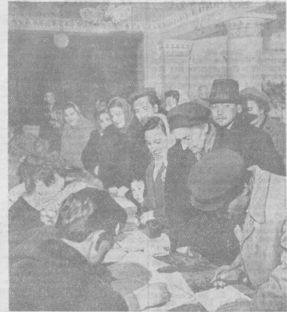
Организовано прошли выборы народных судей в столице Узбекистана. НА СНИМКЕ: на избирательном участке № 154 Кировского района г. Ташкента.

М. АНДРЕЕВА. Артистка балета театра имени Навои.