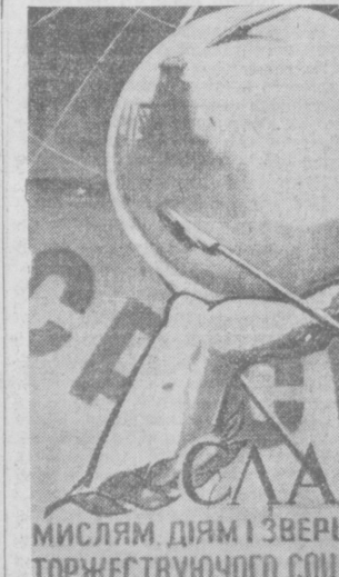
Слава мыслям, делам и свершениям торжествующего социализма! Плакат художника В. Н. КАРМАЗИНА.