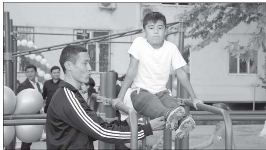
Дар маҳаллаи Богзори шаҳри Тирмиз майдони «Workout» ба истифода сугурда шуд.