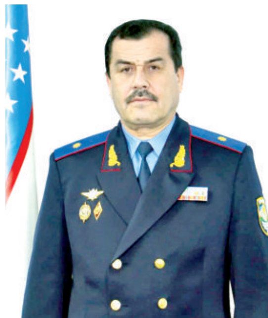
Абдулла ҚҮЛДОШЕВ, Ўзбекистон Республикаси фавқулодда вазиятлар вазири, генерал-майор

аҳоли ва ҳудудларни фавқулодда вазиятлардан муҳофаза қилишнинг ишончли кафолати