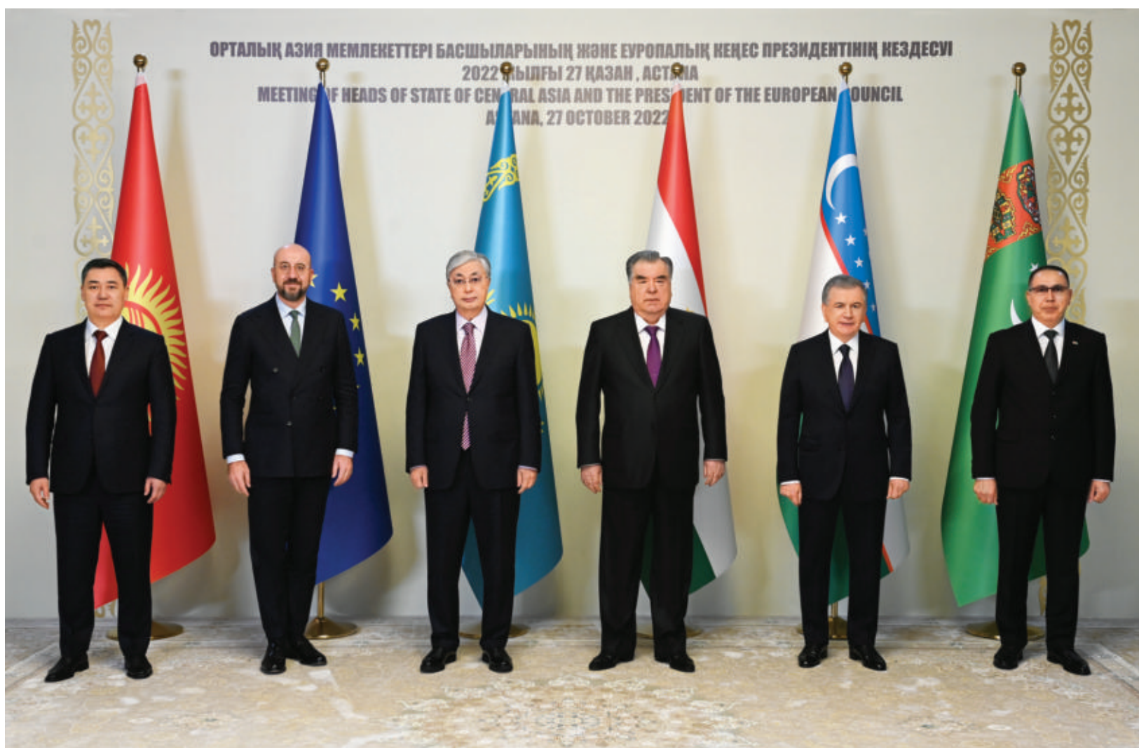
ОРТАЛЫҚ АЗИЯ МЕМЛЕКЕТТЕРИ БАСШЫЛАРЫНЫҢ ЖӨНЕ ЕУРОПАЛЫҚ КЕҢЕС ПРЕЗИДЕНТИНИҢ КЕЗДЕСУ 2022-ҲИДҒЫ 27 ҚАЗАН, АСТОНА MEETING OF HEADS OF STATE OF CENTRAL ASIA AND THE PRESIDENT OF THE EUROPEAN COUNCIL ASTANA, 27 OCTOBER 2022

Ўзбекистон Республикаси Президенти Шавкат Мирзиёев 27 октябрь куни Остона шаҳрида “Марказий Осиё — Европа Иттифоқи” биринчи саммитида иштирок этди.