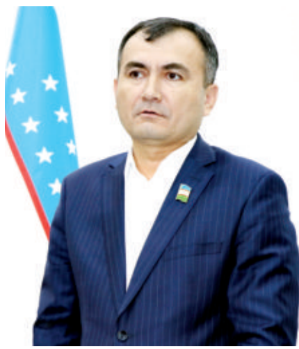
Саноат янада ривожланади