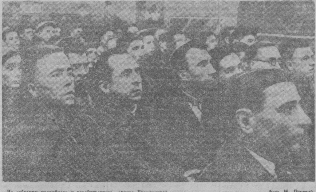
На собрании партийного и хозяйственного актива Чирчикстроя.

В докладе тов. Логинова почему-то ничего не было сказано о монтаже энергетического оборудования. Это, пожалуй, случайно, потому что монтаж энергетической части оборудования является делом чрезвычайно важным. И вот в связи с этим мне бы хотелось поставить такой вопрос. До сих пор у нас все, что касается монтажа электроборудования, концентрировалось в отделе Главного механика. Такой порядок, сейчас, в связи с новыми задачами, поставленными перед коллективом Чирчикстроя, не может нас удовлетворить. Необходимо создать специальный электромонтажный отдел, который бы занимался всеми вопросами, связанными с монтажом электроборудования. Второй вопрос. У нас на Чирчикстрое не хватает кадров электротехников, а они сейчас крайне нужны. Мы рассчитываем на то, что узбекистанские организации окажут нам в этом соответствующую помощь. Первого сентября гидроэлектростанция должна быть пущена. Это значит, что уже сейчас необходимо позаботиться о кадрах эксплуатационников, их надо начать учить теперь же, причем не только по книжкам, но и непосредственно на производстве, в процессе монтажа.