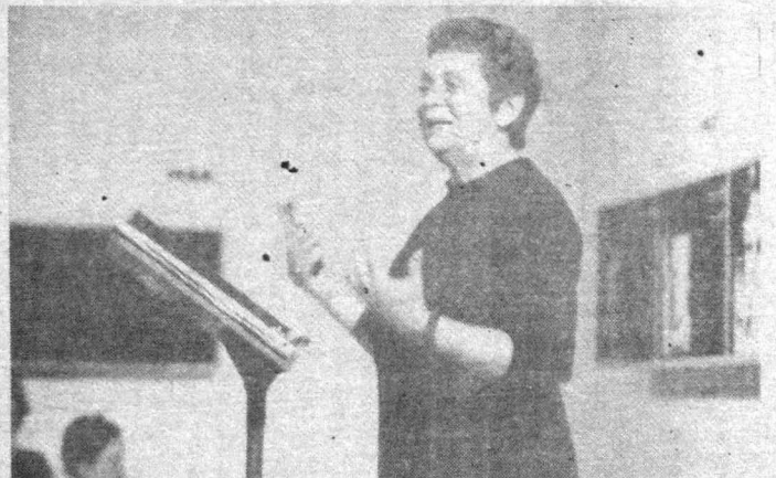
На снимке: 65 лет провела на театральной сцене известная в Израиле актриса Хана Мерон. За эти годы она сыграла более 85 ролей в пьесах Шекспира, Ибсена, Беккета и других замечательных драматургов. (По материалам средств массовой информации).

Во время подготовки к очередному матчу на звание чемпиона мира в колумбийском городке Медельин убит бывший чемпион мира по боксу Элвис Альварес.