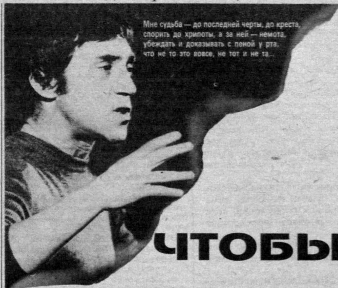
Мне судьба — до последней черты, до креста, спорить до хрипоты, а за ней — немота, убеждать и доказывать с пеной у рта, что не то это вовсе, не тот и не та...