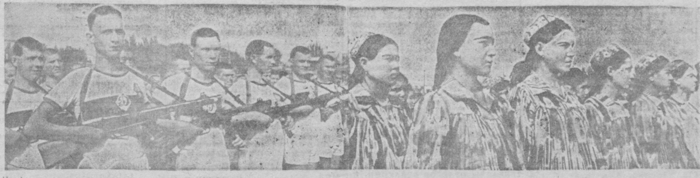
На физкультурном параде в честь открытия III Республиканской Спартакиады на стадионе «Спартак» в Ташкенте.