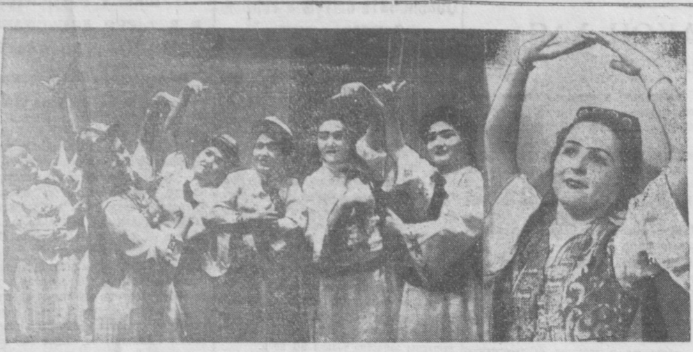
Этот ансамбль родился в местах, овеянных народной легендой, там, где тысячи труженников — колхозников, рабочих, инженеров воздвигают крупнейшую в республике гидроэлектростанцию. У подножья Фархадских скал, где протекает многоточная Сыр-Дарья, вскоре возникнет промышленный город. Уже видны его замечательные контуры... Здесь начал свою творческую жизнь театр Фархадского и его ансамбль песни и пляски. Ансамбль исполняет не только песни и музыку, написанные композиторами. Он черпает у народа, у строителей электростанции его напевы, рожденные радостью создания. Здесь рождается новый народный фольклор. С особенной предельно звучит он в исполнении народных мастеров песни и пляски. Вот уже несколько дней ансамбль театра Фархадского с успехом выступает в театральных и концертных залах Ташкента. На снимке: (слева) уйгурский танец в исполнении ансамбля. Справа — солистка балета Р. Сайфуллина.